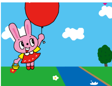
うさちゃん どこいくの?