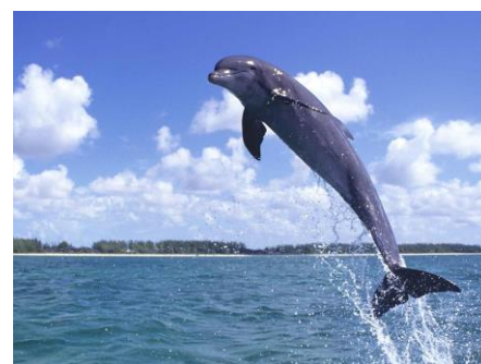
「ペンギン・イルカ300」より

夏休みの自由研究にも参考資料として大いに活用できますので、お子様に対して親御様からぜひ紹介していただきたい、“この夏一押し”のアプリ作品と言えるのではないのでしょうか。