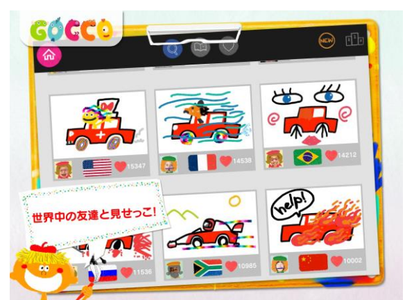
世界中の投稿作品がズラリ、みんなで見せっこ