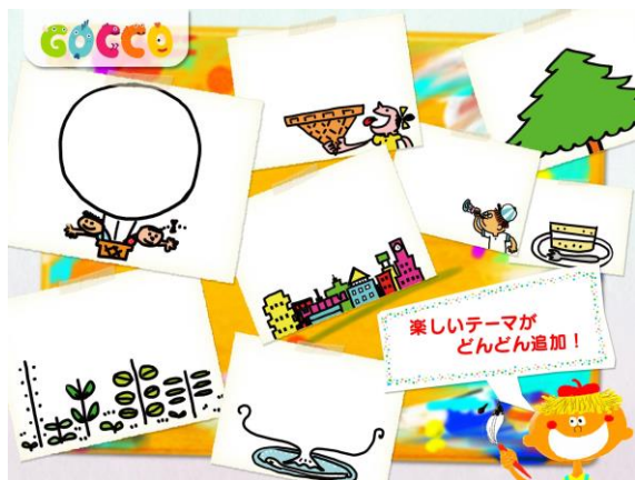
選べるテーマ(下絵)

なお、昨年11月から全世界に展開しているアプリシリーズ「Gocco(ごっこ)」の好調ぶりを背景に、海外(日本含まず※)での当社アプリ累計DL数は、175万を突破しました(2月18日現在)。当社では、引き続き「Gocco」の新作を全世界へ提供していく計画です。 ※日本を含む、全世界での累計DL数は658万(2月18日現在)