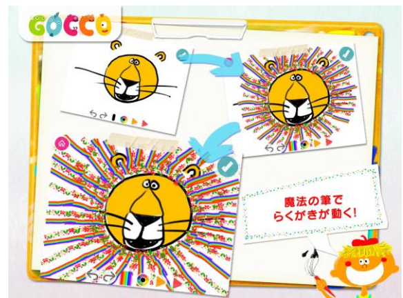
カラフルで自由に描ける筆