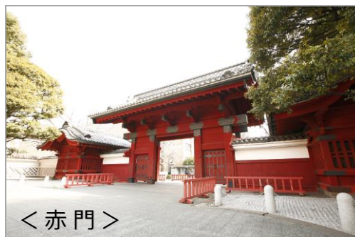
< 赤門 >

「授業にタブレット端末等を導入」という小中学校での動きは、もはや珍しくありませんが、本カンファレンスは「タブレット端末等を活用した、幼児のIT活用教育」をテーマにしたもので、主に幼稚園・保育園などの経営者・園長・教諭・保育士らを対象に開催します。